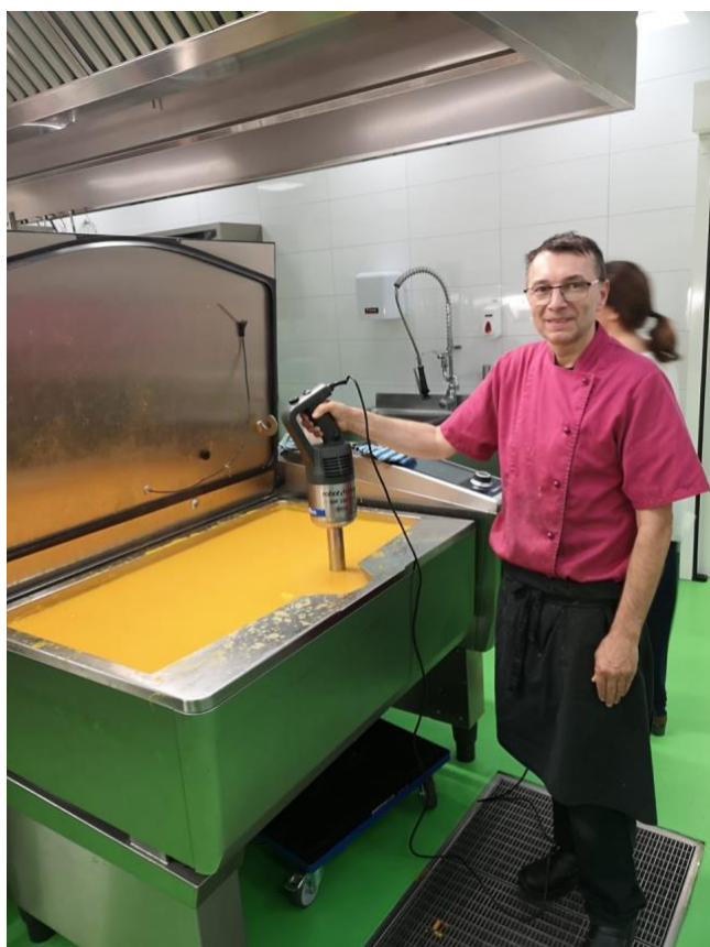
Cuisinier de "Terre Vaudoise"

Des victuailles furent commandées auprès de professionnels et le service fut assuré par les membres de nos deux associations de quartier, reconnaissables à leur tabliers orange et à leurs chapeaux pointus.