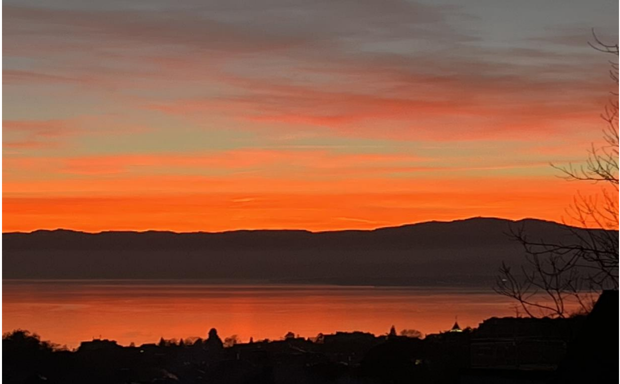
Coucher de soleil hivernal

DOUZIÈME année, N° 61, Janvier-Février 2025