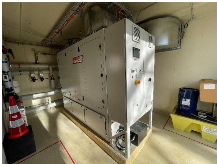
Couplage chaleur force

Les travaux ont débuté en novembre 2022 par le démontage de l'ancienne installation et la mise en place du nouvel équipement. Après le raccordement de la tuyauterie, de la ventilation et des câbles électriques, le nouvel appareil était mis en service en décembre de la même année.